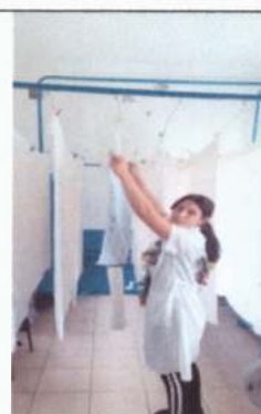
Машинист по стирке белья